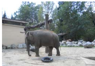
L'elefante con i suoi giochi

Poi c'era la zona degli animali feroci come i leoni e i gheparidi, questi erano tra i pochi animali ad essere nelle gabbie. E ancora scimmiette dispettose, pappagalli colorati, canguri e persino le zebre, col loro bel completo a strisce!!! Che fortuna poter vedere così tanti animali in un posto così bello e così ben tenuto.