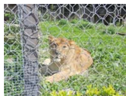
Una leonessa che ci guarda

giavamo abbiamo capito che questo è uno zoo un po' speciale, poiché ha pochissime gabbie e quasi tutti gli animali hanno degli spaziosi e puliti recinti. C'era un grandissimo recinto per stambecchi, cervi e camosci, e lì vicino sotto ad una grande tettoia in legno ci siamo rifocillati con i nostri fantastici cestini.