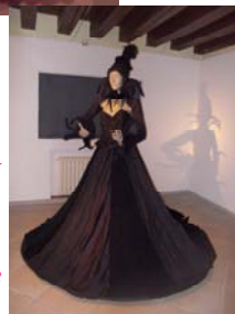
Gazebo, Arancia, Notte