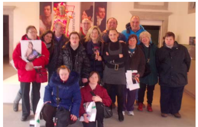
Tutti insieme a palazzo Attenti a Gorizia!

promesso di venire a Trieste per la nostra mostra che faremo a settembre: lei si è dimostrata entusiasta del nostro invito.