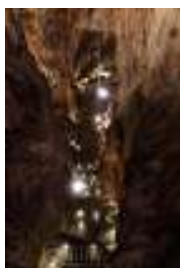
IN QUESTA FOTO E' VISIBILE UNA PARTE DELLA SCALINATA.

La grotta è costituita da un'unica immensa cavità lunga 280 metri, larga 65 e alta ben 107 metri. Il percorso che porta alla base della caverna è fatto da 1000 scalini; lo spettacolo è unico sia per la maestosità della cavità sia per la ricchezza e la variabilità delle forme e dei colori di stalattiti e stalagmiti .