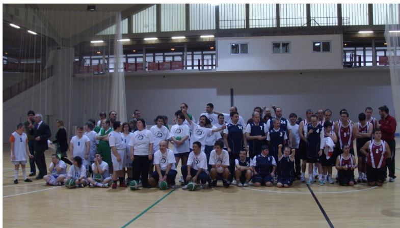
Foto del torneo 2011

Aria fresca settembrina, alla sera e alla mattina.