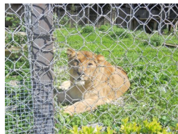
Una leonessa che ci guarda

giavamo abbiamo capito che questo è uno zoo un po' speciale, poiché ha pochissime gabbie e quasi tutti gli animali hanno degli spaziosi e puliti recinti. C'era un grandissimo recinto per stambecchi, cervi e camosci, e lì vicino sotto ad una grande tettoia in legno ci siamo rifocillati con i nostri fantastici cestini.