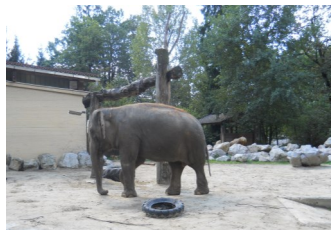
L'elefante con i suoi giochi